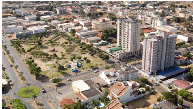
Imagem aérea da região central de Primavera do Leste

Primavera do Leste era chamada de Bela Vista das Placas, Rodovia 070, Km 150, Entroncamento Paranatinga. A Fundação e implantação do projeto Cidade de Primavera ocorreu no dia 26 de setembro de 1979, projetada pela Construtora e Imobiliária Consentino.